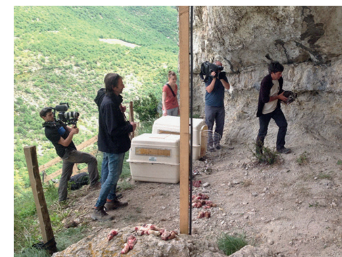
Volcaire va être déposé sur son nid