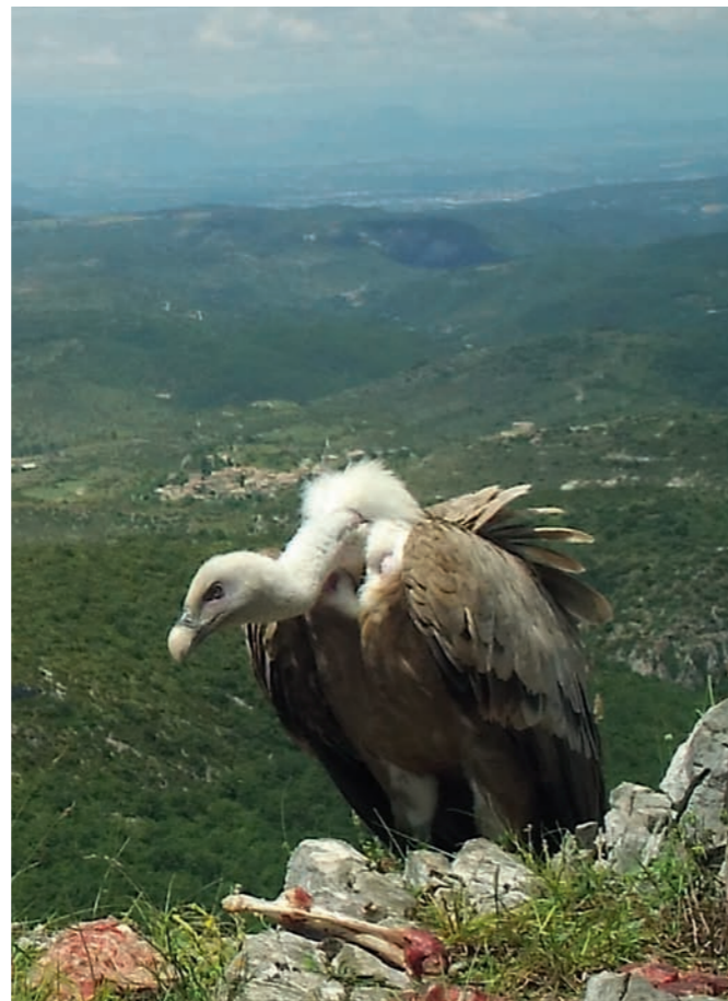
Site de nourrissage dans le département de l'Ardèche visité par un Vautour fauve