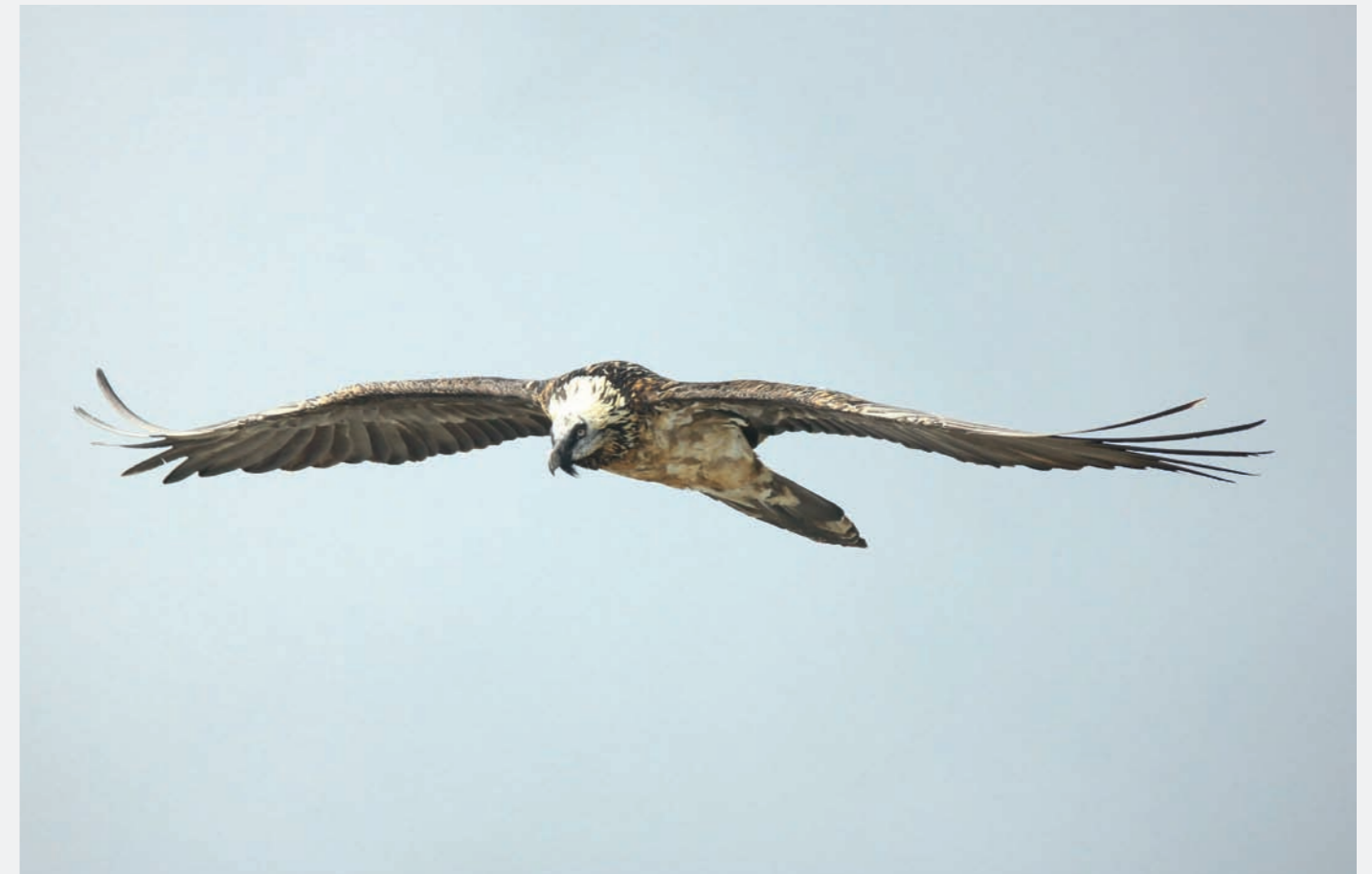
Gypaètes barbus en vol © Jean Révolat

Julien Traversier - Vautours en Baronnies