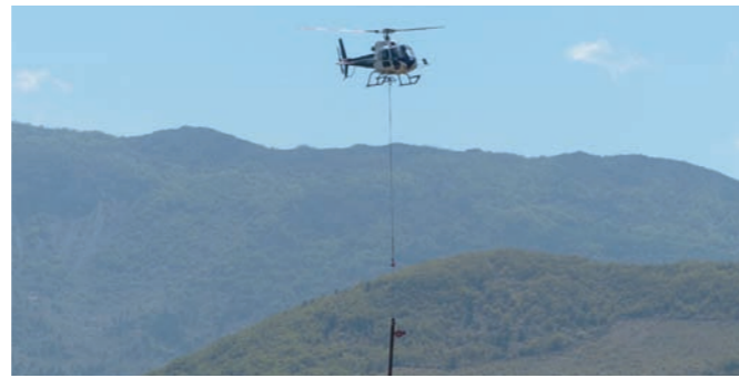
Travaux de neutralisation