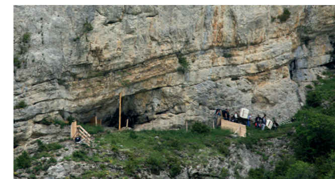
Arrivée des oiseaux sur le taquet