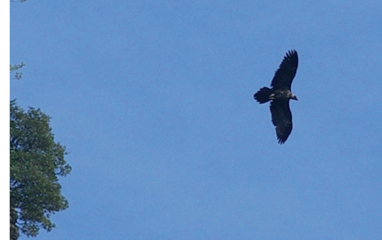
Roc Genèse en vol