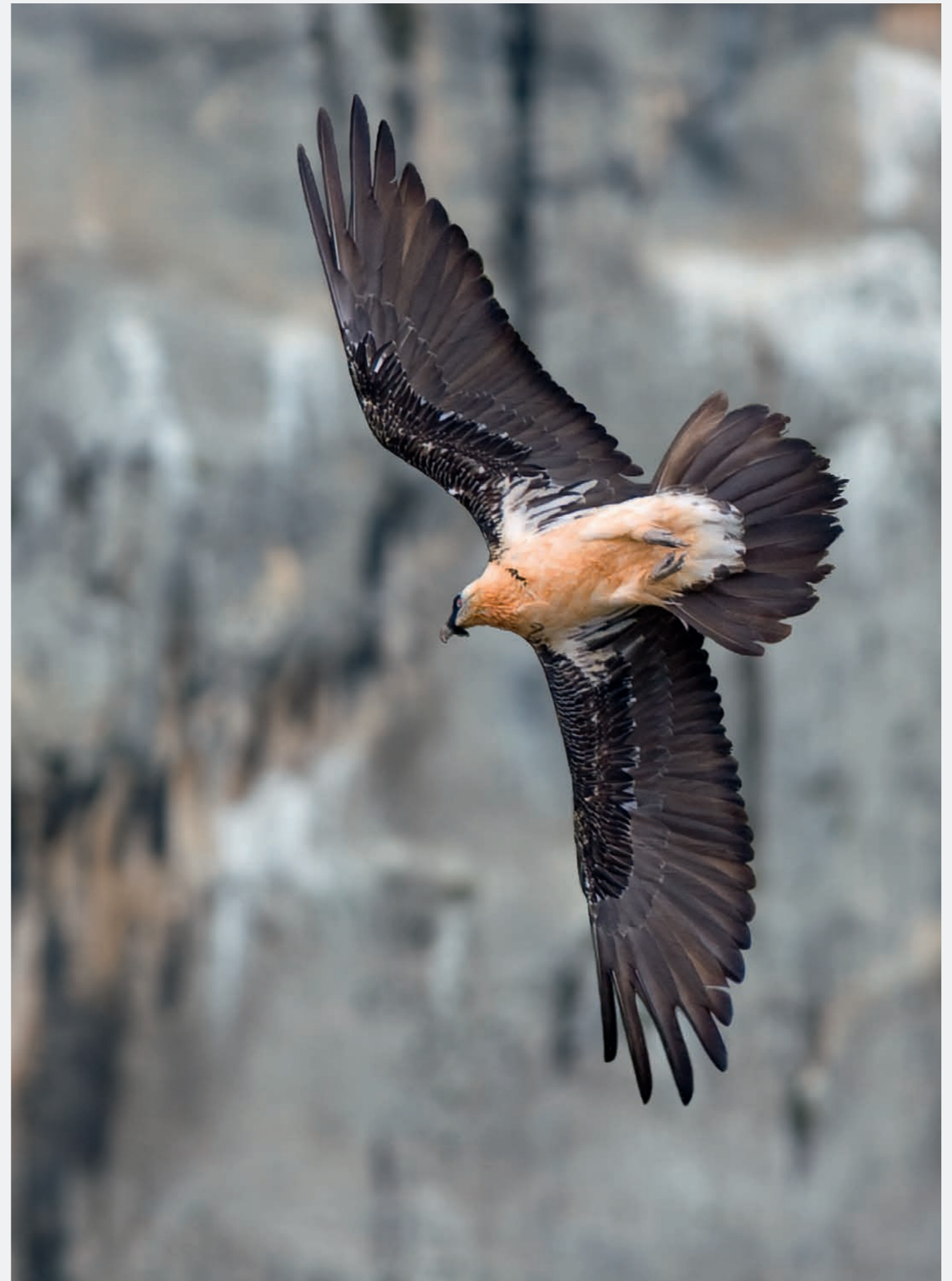
Gypaète barbu