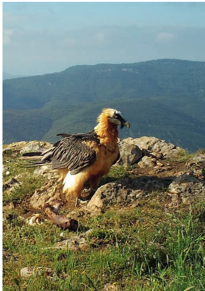
Site de nourrissage des Corbières fréquenté par un Gypaète barbu