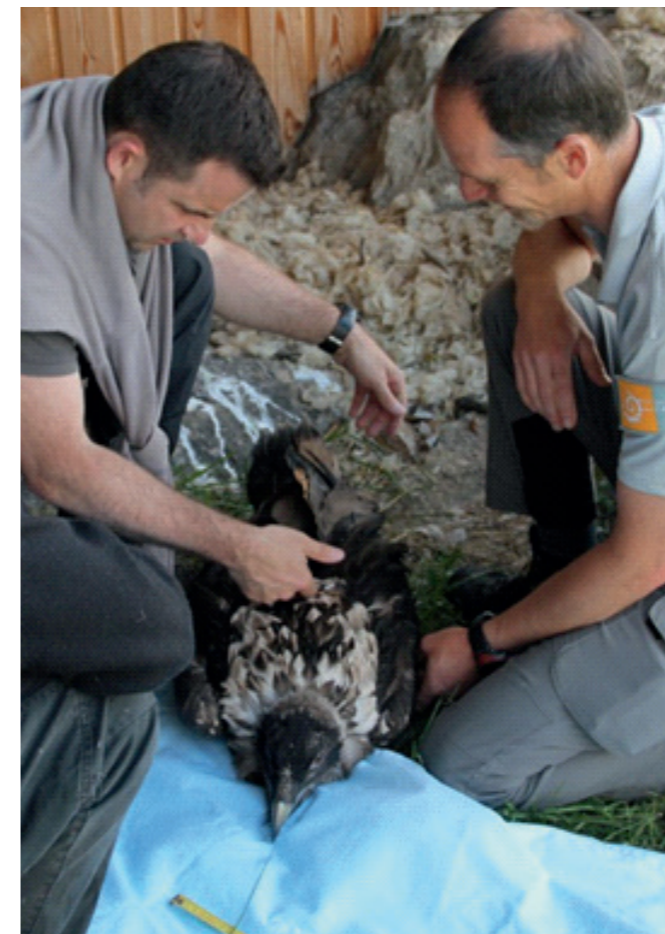
(4) Poses des balises

D'autres animations sont également proposées pour les petits et les grands, du 1er juillet au 10 août : des sorties familles, des sorties nature ; et également des veillées « Gypaète barbu » organisées par la LPO Grands Causses et le Parc National des Cévennes.