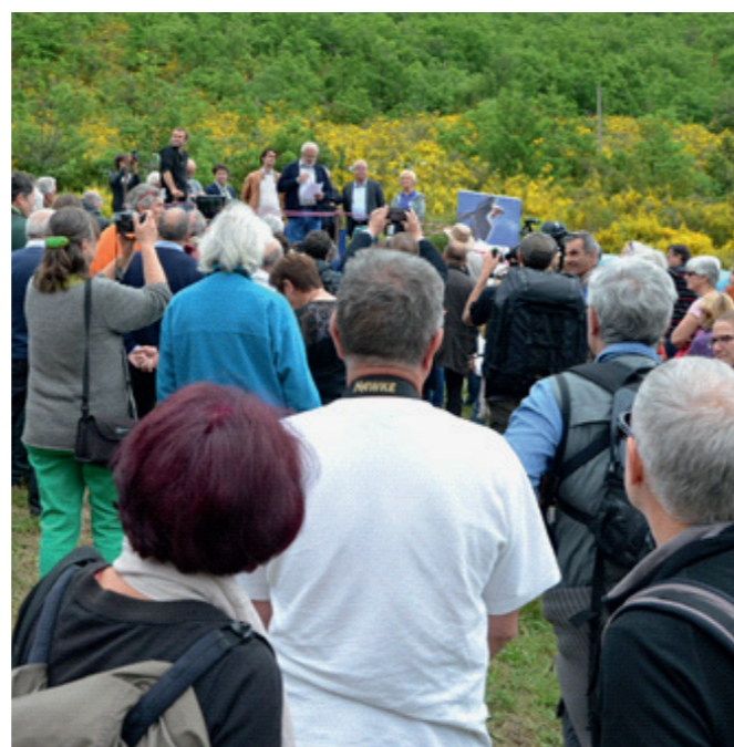
L'assistance au moment des discours

Julien Traversier - Vautours en Baronnies