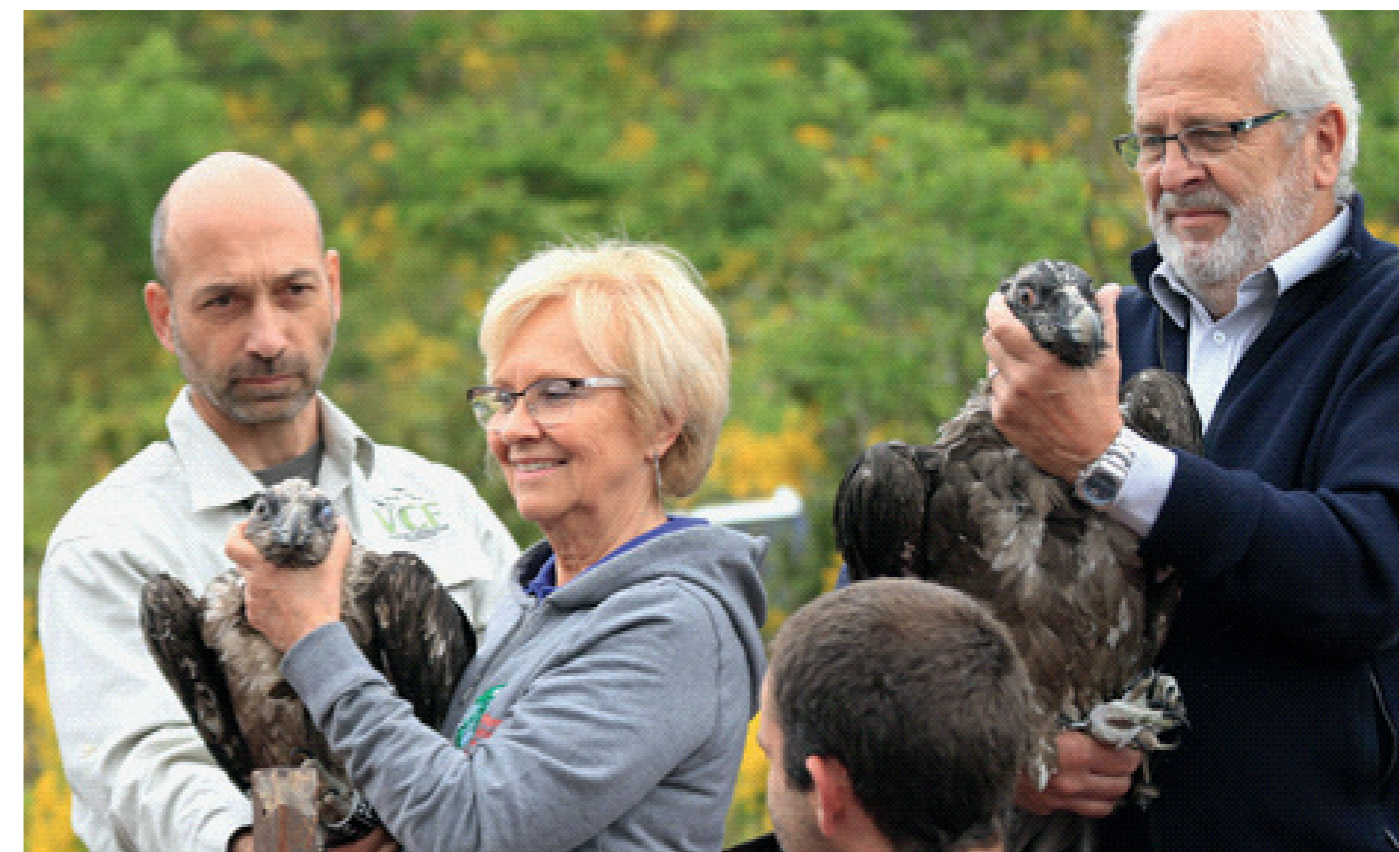
Présentation des oiseaux