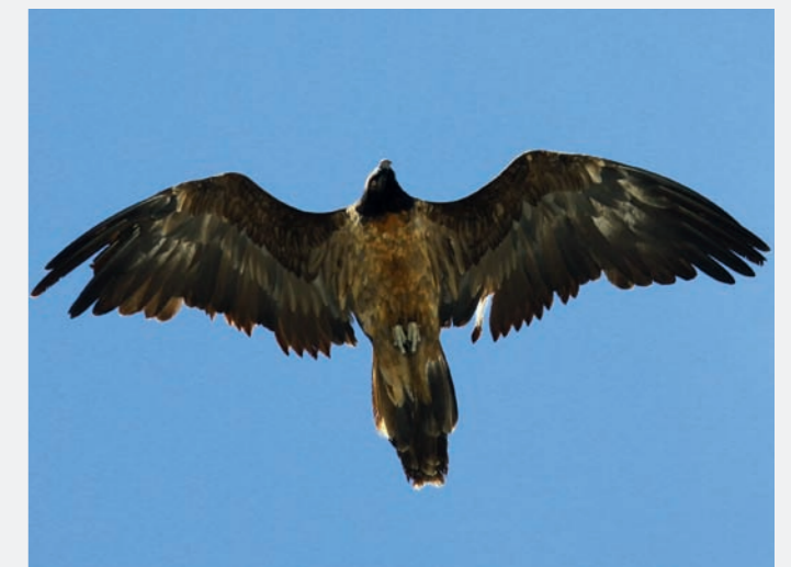
Gypaètes barbus en vol