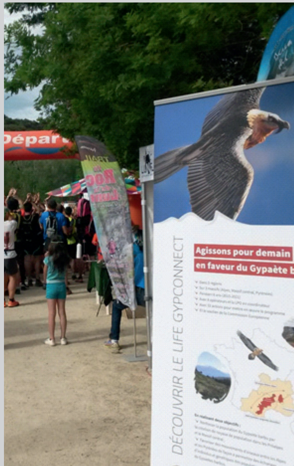
Sensibilisation au LIFE GYPCONNECT