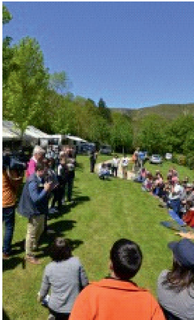
(1) Présentation des oiseaux