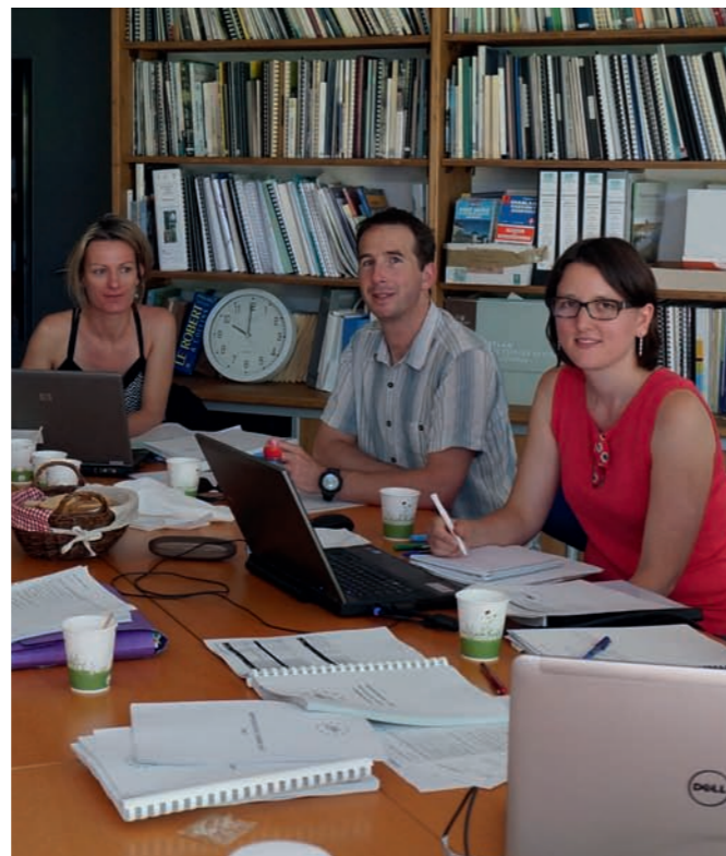
Réunion autour du GypHelp, autre LIFE consacré au gypaète