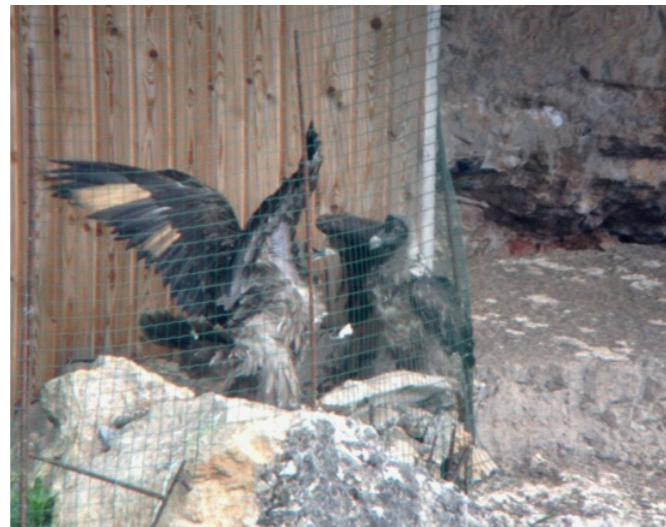
(2) Interactions entre les oiseaux