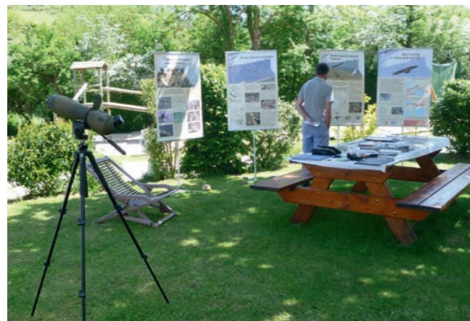
(3) Poste d'observation et exposition